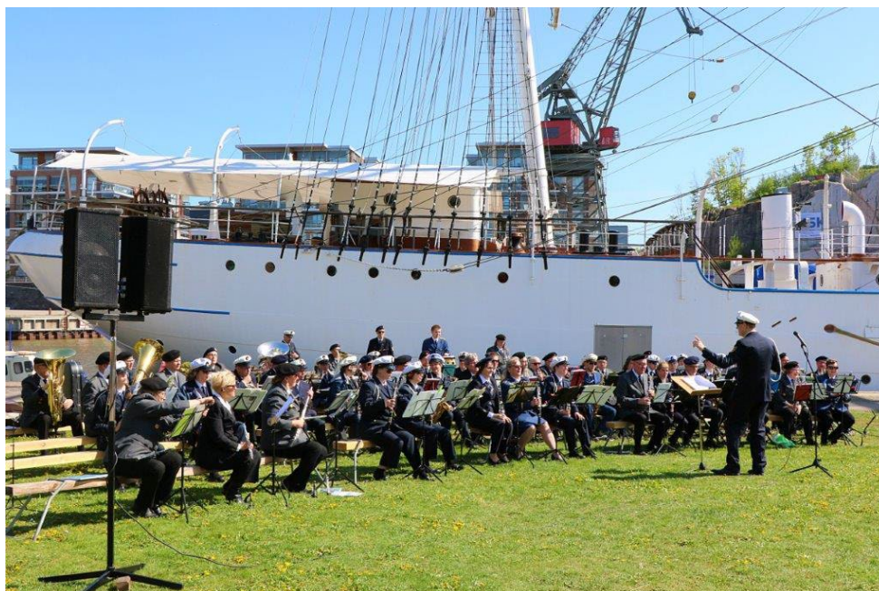
Åbo FBK hornorkester spelar vid tävlingsplanen