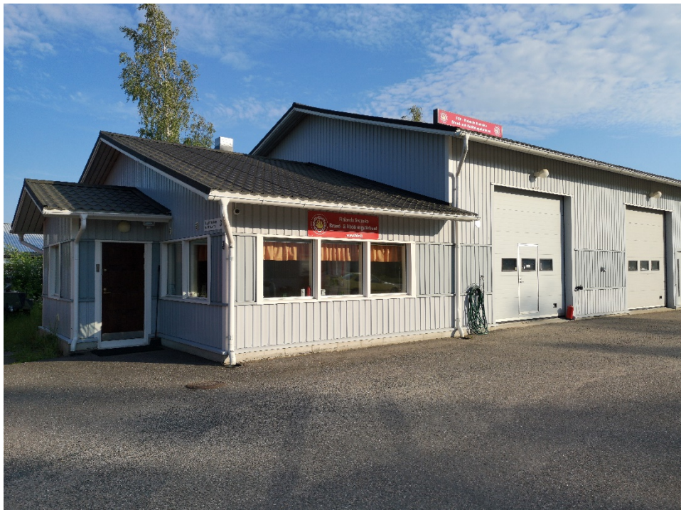
Chaufförsvägen 3, Ekenäs

Finlands Svenska Brand- och Räddningsförbunds vårmöte den tisdagen 11 maj 2021.